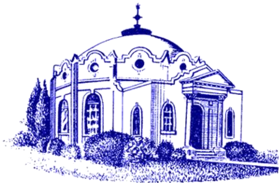
Mount Ecclesia, Oceanside, USA