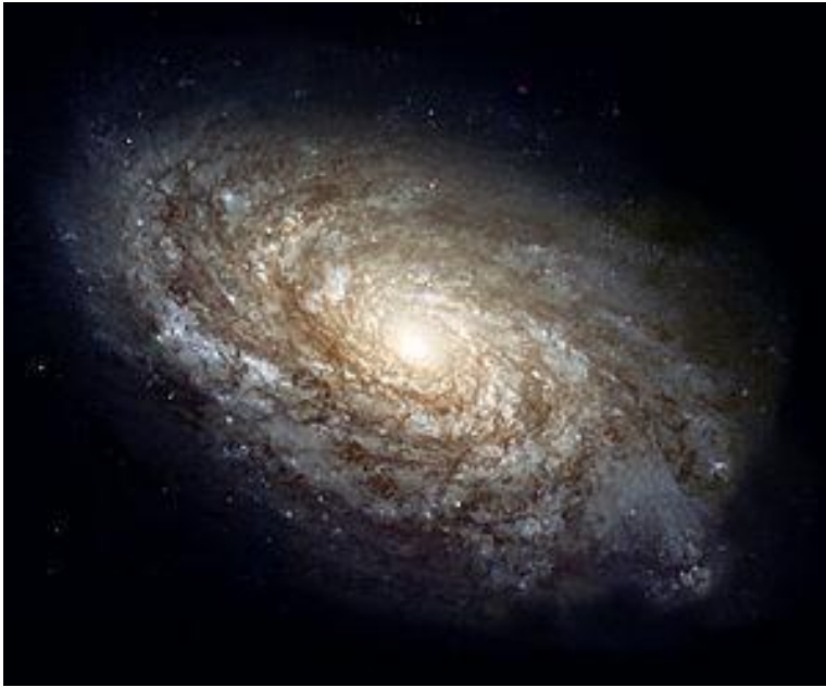
NGC 4414, uma galáxia espiral típica na constelação Coma Berenices, tem 55 mil anos-luz de diâmetro e está a aproximadamente 60 milhões de anos-luz da Terra

Se estudamos a grande abóboda celeste e examinamos a nebulosa espiralada, que são mundos em formação, ou os caminhos percorridos pelos sistemas solares, fica evidente que a espiral é o caminho do progresso.