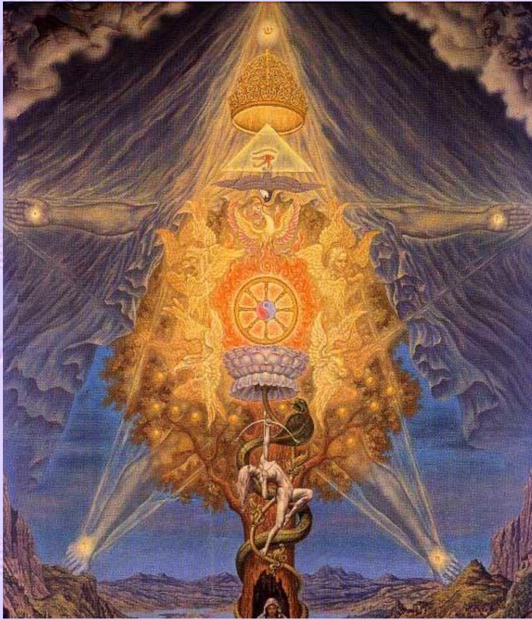
INTERIOR OF UNIO MYSTICA (1973) by Jophra