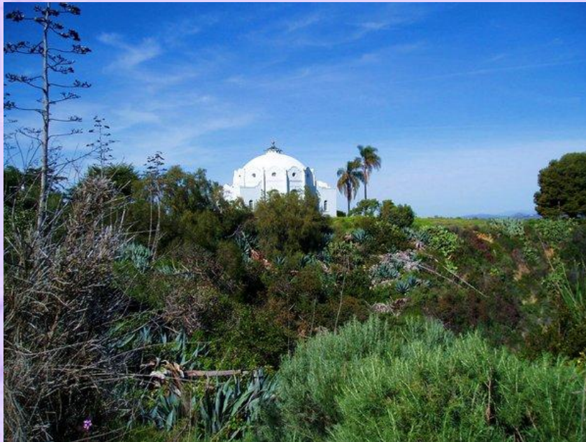
Templo Rosacruz em Mount Ecclesia, Oceanside, California.

A Fraternidade Rosacruz Max Heindel não é uma seita ou organização religiosa, mas sim uma grande Escola de Pensamento. Sua finalidade precípua é divulgar a admirável filosofia dos Rosacruzes, tal como ela foi transmitida ao mundo por Max Heindel, escolhido para esse fim pelos Irmãos Maiores da Ordem Espiritual.